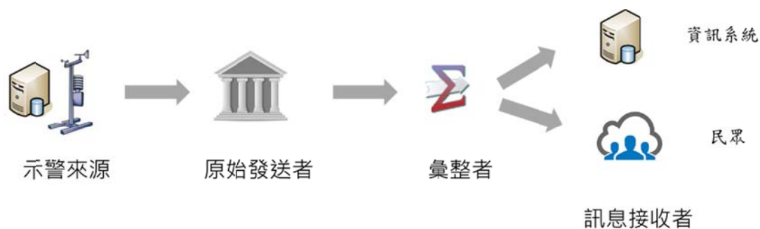
圖 1 示警訊息的流通方式

另外，示警訊息的提供也需考量其他國籍的接收者，因此亦必須考量到示警訊息的多語化。